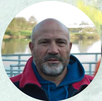
Jesús Cobos Tellez Entrenador nacional de piragüismo