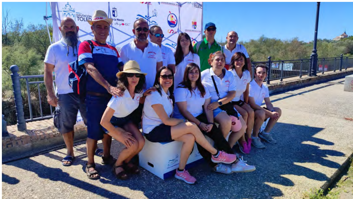
Equipo Arbitral de la Federación de Castilla-La Mancha en el Trofeo de Ferias de Talavera de la Reina.

+ info: https://www.fcmp.es/afiliacion-y-cuotas/