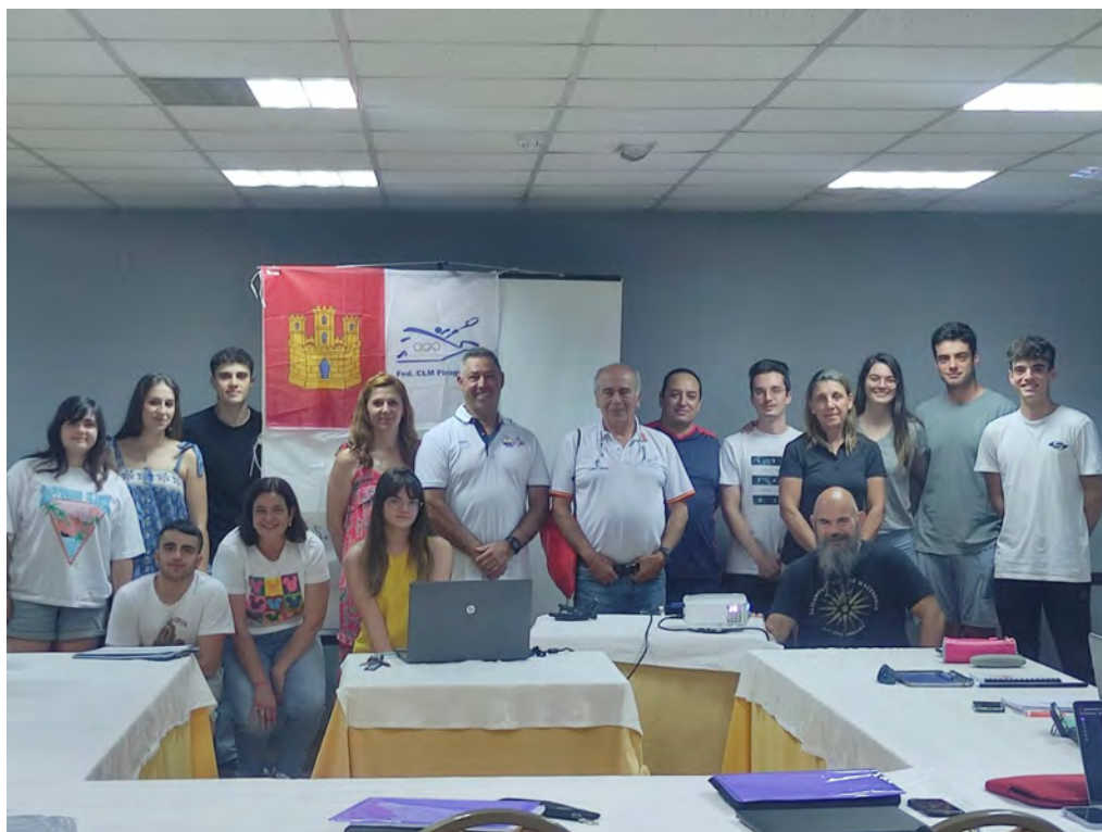
Curso de árbitros nacionales, básicos y auxiliares en Talavera de la Reina.