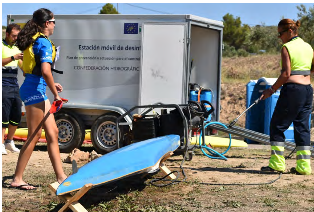
Operaria de desinfección de la CH Tajo en el Open Interterritorial del Dique de Pareja.

+ info: https://www.fcmp.es/navegacion-y-medioambiente/