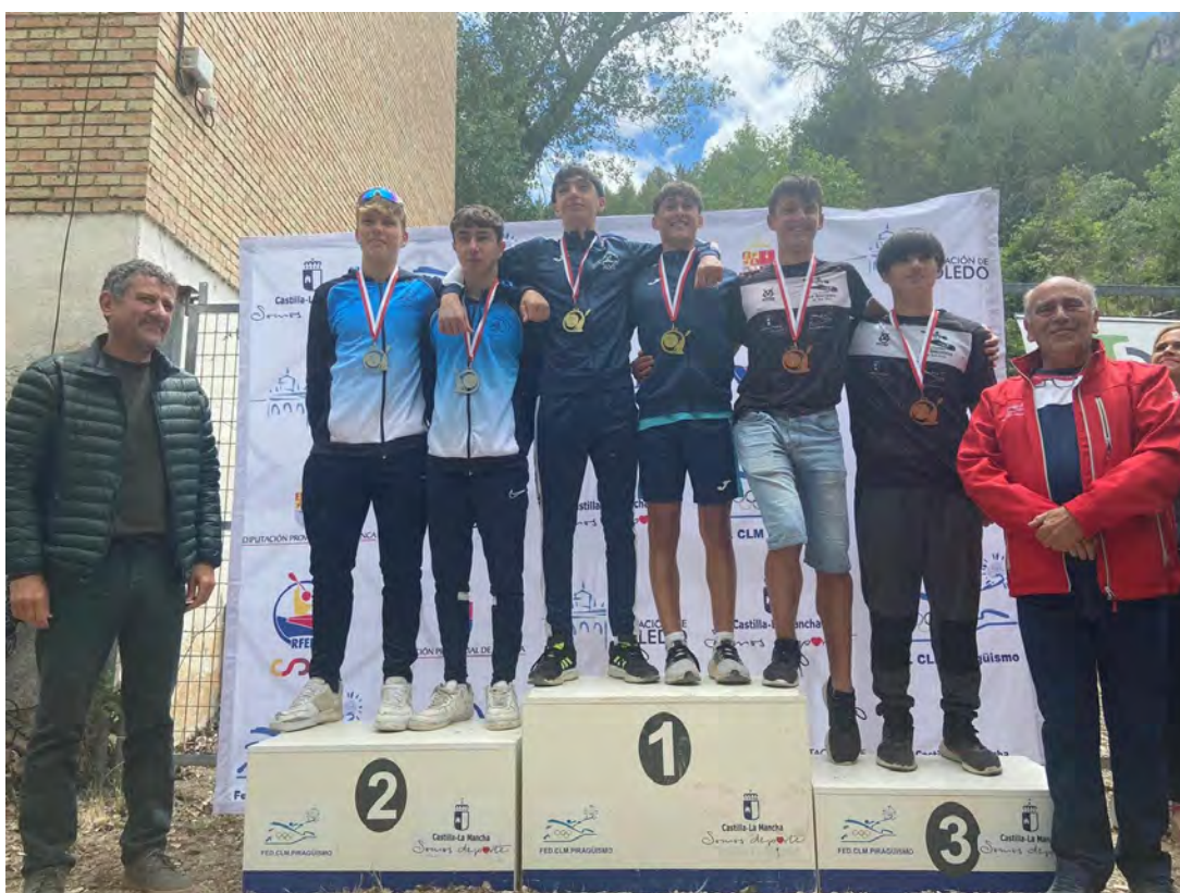
Podio K2 Cadete Hombre en el Trofeo Diputación de Cuenca-Campeonato Promesas de CLM