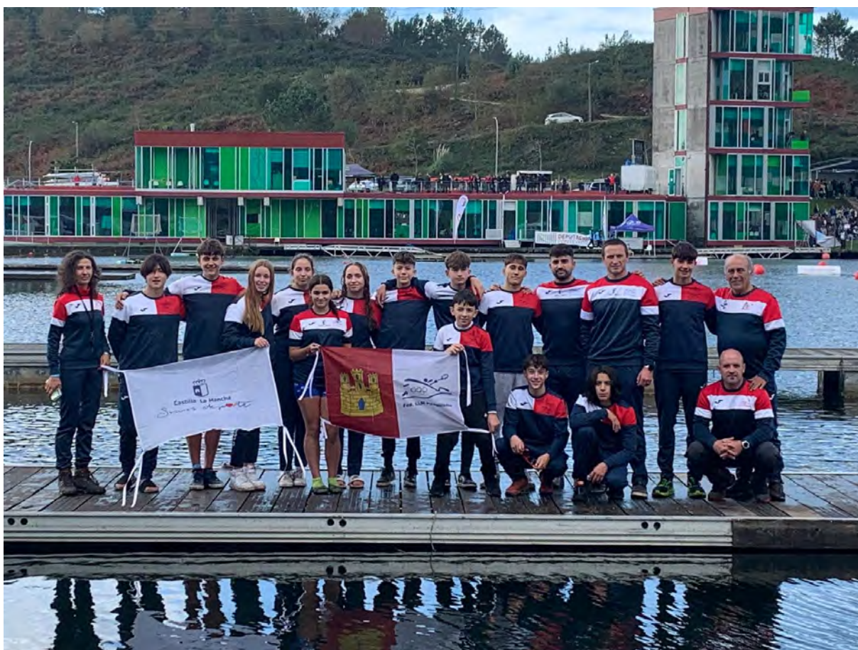
Selección Autonómica de Deporte Escolar de Castilla-La Mancha