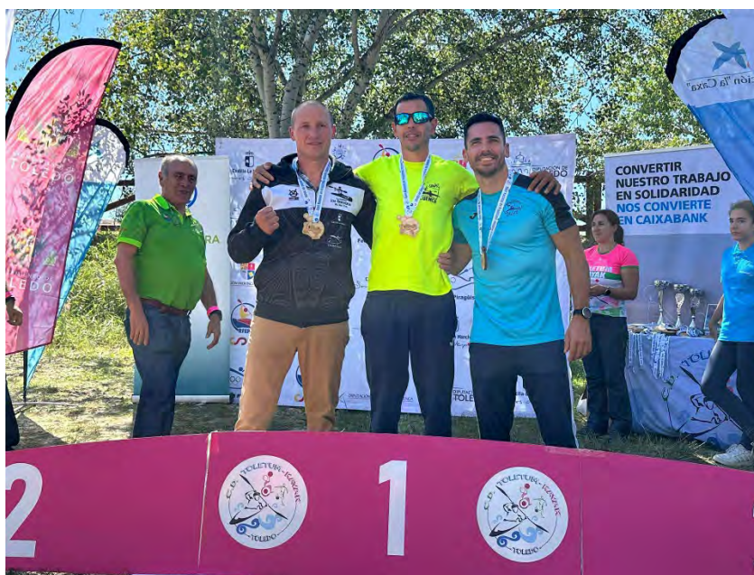
Podio en el I Open Nacional de Piragüismo Inclusivo