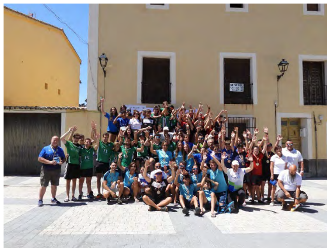
Participantes en la II Regata de Fondo de Pareja (La Alcarria)

Agradecemos a la Concejala de Deportes de Pareja su presencia, apoyo y colaboración en esta competición.