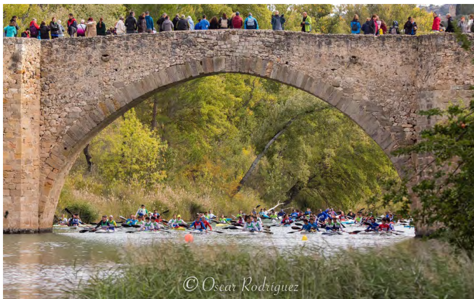
Salida en el V Trofeo Puentes Romano s.XXI