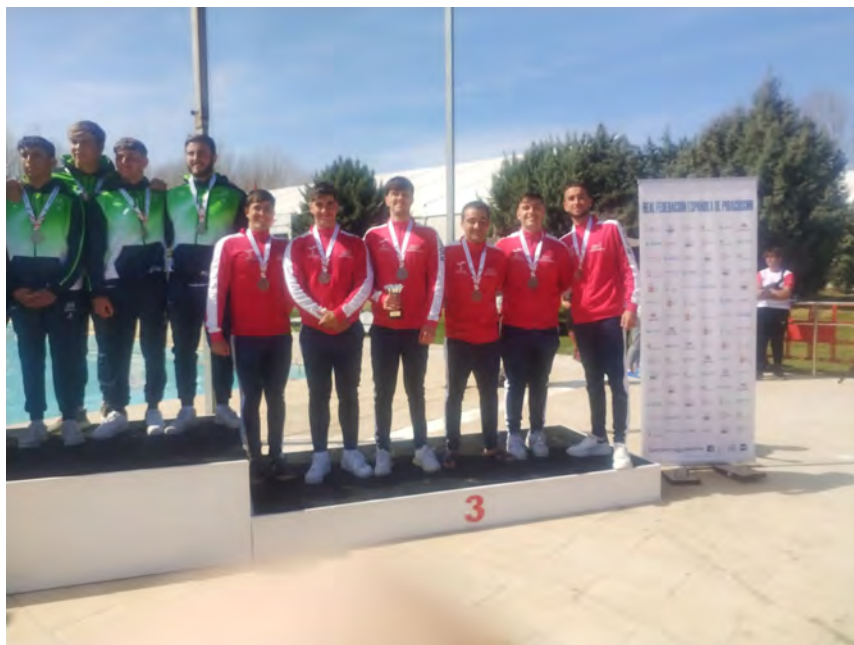
Equipo Sub-21 de Castilla-La Mancha en el Campeonato de España de Kayak Polo por Selecciones Autonómicas