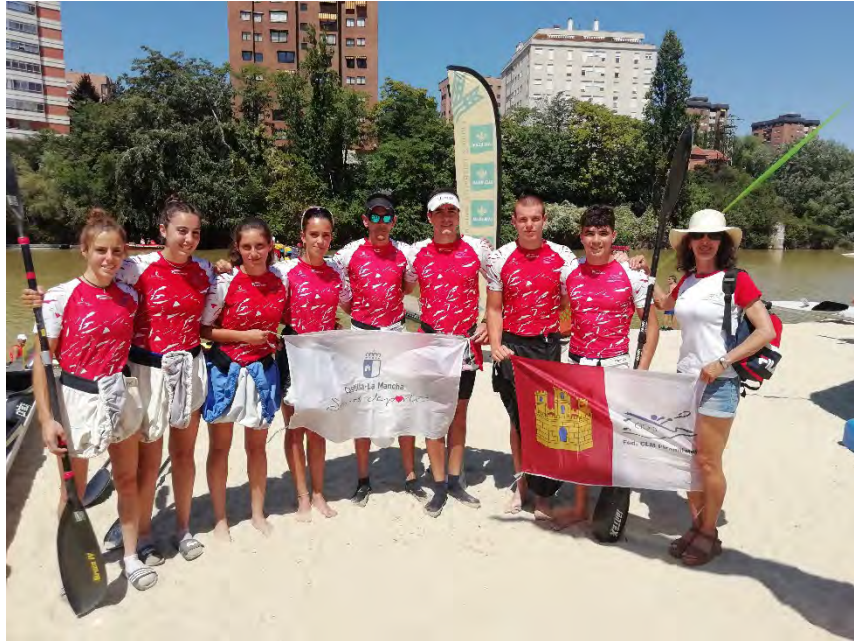
Tripulaciones y técnica del K4 del Equipo de Castilla-La Mancha en el Gran Premio K4 Internacional Castilla y León

El gasto correspondiente total ha sido de 4.745,46 €, con un ingreso de la FPCYL por desplazamiento al Gran Premio K4-CYL de 525,00 €, con lo que ha quedado un coste de 4.220,46 €, sobre un presupuesto de 4.000 €, quedando pendiente de pagar 4.172,58 €.