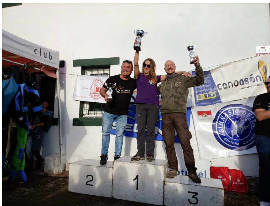
Club Tronchapalas: 3º en el podio por clubes en el Campeonato Internacional de Kayak Extremo de Cantabria

Se han asignado 465,00 €, pendientes de pago, para ayudas por gastos de desplazamiento de clubes sobre un presupuesto de 2.000 €.