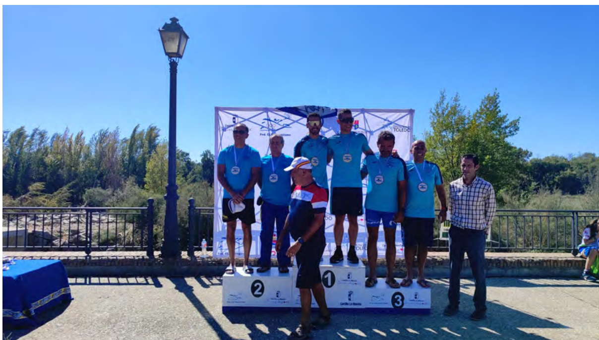
Podio K2-Hombre del XXXII Trofeo de Ferias