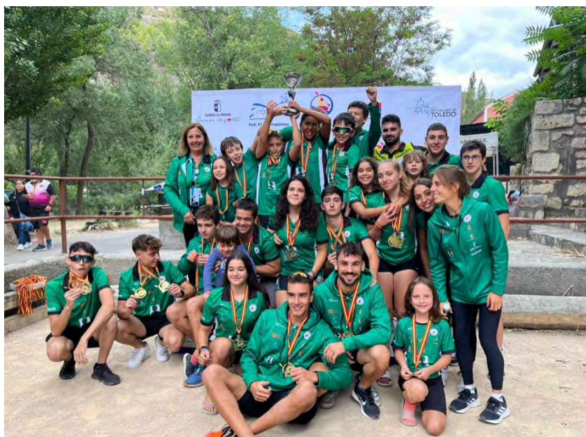
Cuenca Con Carácter, club organizador del XXII Trofeo Puente a Puente